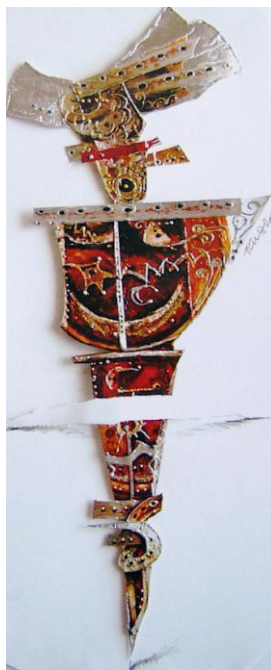
Flora Keris Melayu Sakti (2004) Mohd Mustafa bin Mohd Ghazali