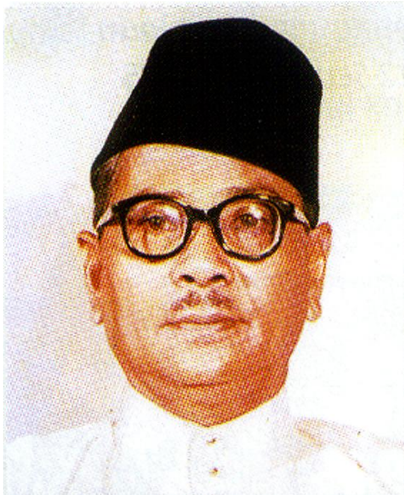
Yang Teramat Mulia Tunku Abdul Rahman Putra Al-Haj